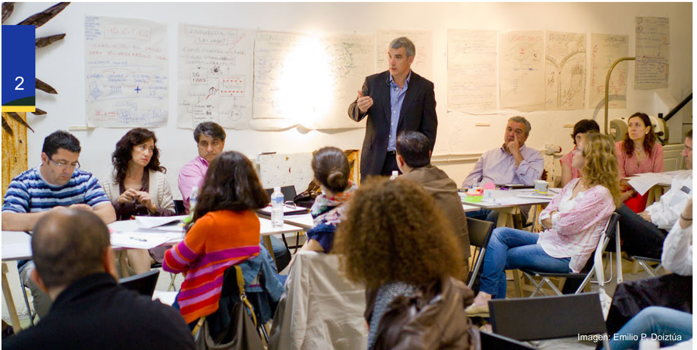
Imagen: Emilio P. Doiztúa